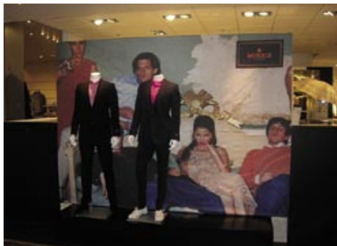
För klädmärket Morris har TOBEX tryckt en 2 x 6 meter stor vepa i bomullsatin.

Newhouse Design KB S.O.L Reklambyrå Textilmuseet i Borås Textilhögskolan vid Högskolan i Borås