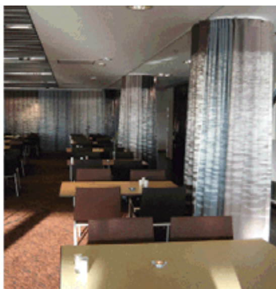
På Clarion Hotel i Stockholm finns gardinerna Soft Walls, av designern Johanna Lindgren. Trycket är gjort på Trevira CS/flamskyddat tyg hos TOBEX. Foto: Johanna Lindgren